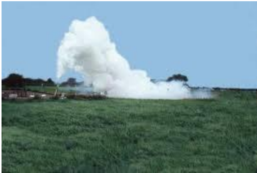
Obr. 3: Sesedání oblaku aerosolu tvořeného amoniakem při úniku typu „jet“ [13].

Na základě výpočtu pak platí: Ri_o \leq 1 – plyn se bude rozptylovat pasivním způsobem; Ri_o > 1 – plyn se bude rozptylovat ne-pasivním způsobem; Ri_o \gg 1 – plyn se bude chovat jako těžký plyn [11].