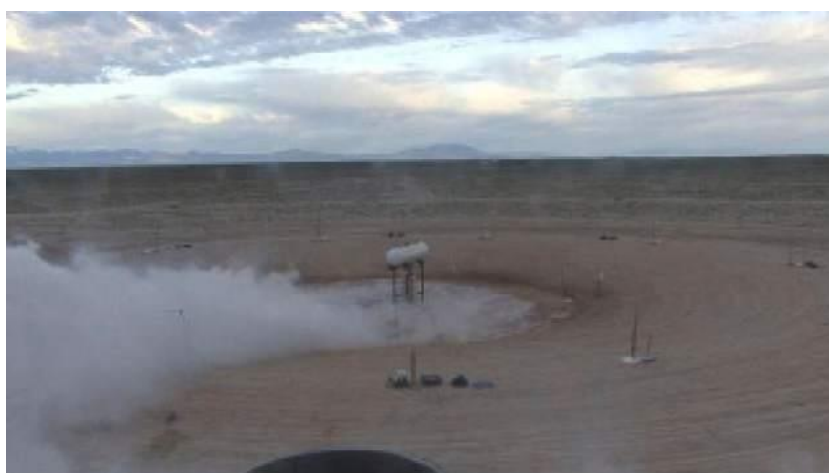
Obr. 6: Naředění oblaku aerosolu tvořeného amoniakem a jeho rozptyl pasivním způsobem (Jack Rabbit Test Program, U.S. Department of Homeland Security & U.S. Army, 2010) [15].