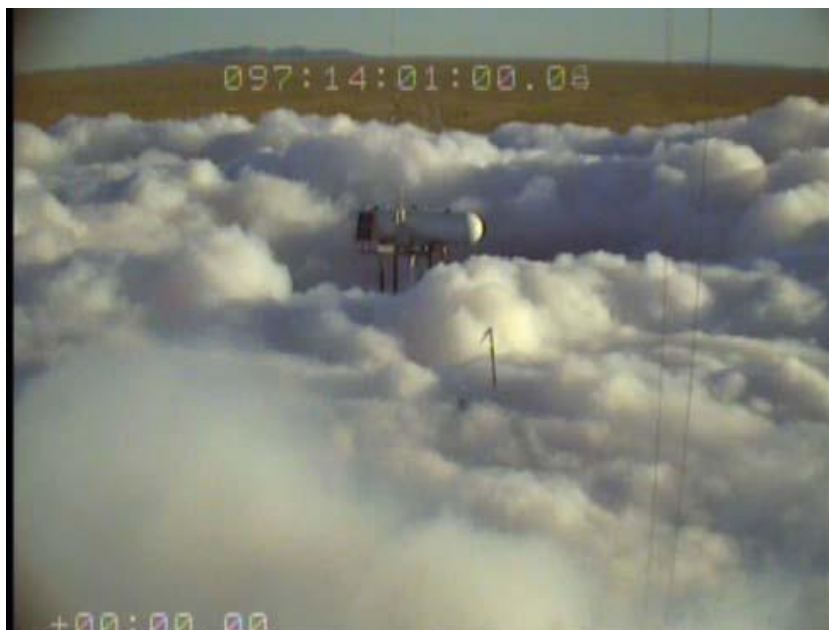
Obr. 5: Víření oblaku aerosolu tvořeného amoniakem (Jack Rabbit Test Program, U.S. Department of Homeland Security & U.S. Army, 2010) [15].