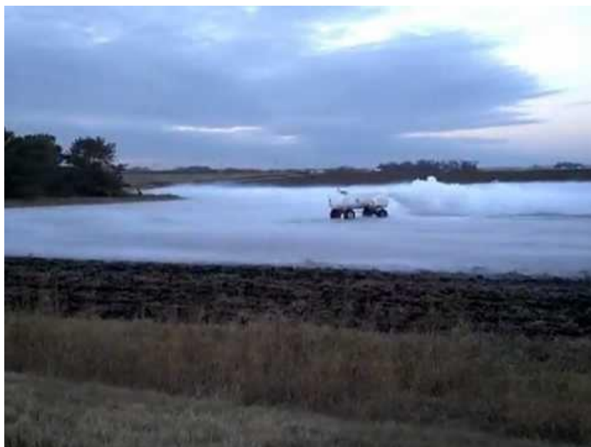
Obr. 1: Oblak aerosolu těžkého plynu za bezvětří [4].

Je-li dotace látky během úniku skutečně velká a úbytek tepla rychlý, což nastává zejména při dvoufázovém úniku zkapalněných plynů nebo únicích typu „jet“, dochází současně též ke vzniku disperze. Disperze představuje aerosol tvořený viditelným shlukem drobných, okem nerozeznatelných, kapiček (např. při úniku zkapalněného kyslíku, dusíku nebo amoniaku) nebo krystalků (např. při úniku stlačeného oxidu uhličitého). Tento oblak je pozorovatelný tehdy, je-li jeho hustota alespoň o 1% větší než hustota vzduchu [5]. Obě tyto situace ilustrativně zachycuje obrázek 2