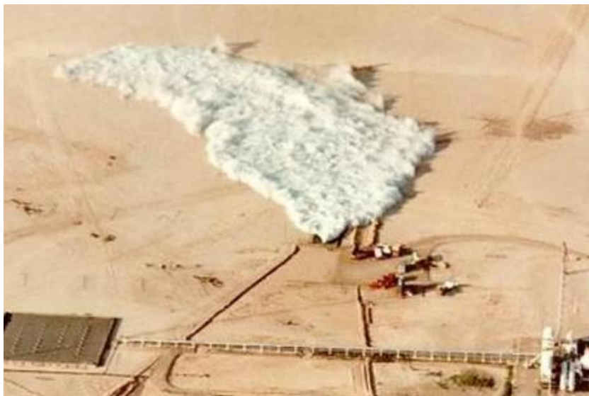
Obr. 4: Tečení oblaku aerosolu tvořeného fluorovodíkem (Goldfish Test Series, AMOCO Oil Company & Lawrence Livermore National Laboratory, 1986) [14].